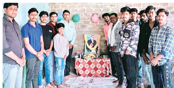
हरिभूमि न्यूज | लखनवास