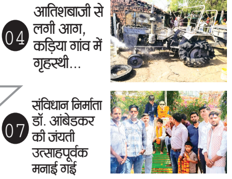
04 आतिशबाजी से लगी आग, कड़िया गांव में गृहस्थी...