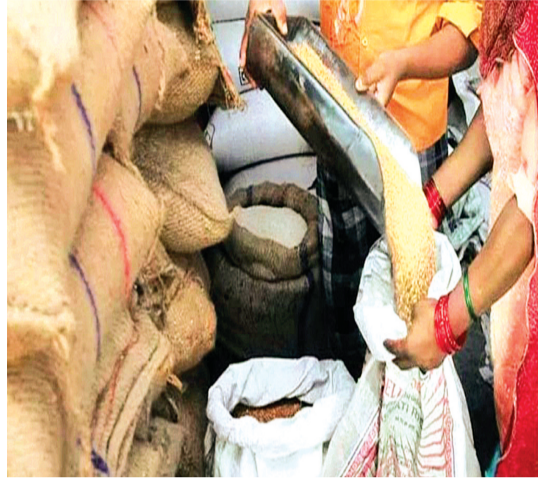
हरिभूमि न्यूज | राजगढ़

सार्वजनिक वितरण प्रणाली (पीडीएस) के तहत जिले के सभी पात्र उपभोक्ताओं को इसी अप्रैल माह में मई एवं जून का भी इकट्ठा राशन देना शुरू कर दिया गया है। विभाग ने सभी राशन दुकानों पर गेहूँ, चावल, शक्कर, नमक आदि पहुंचावा भी दिए हैं। गत 13 अप्रैल से जिले के 12 लाख 89 हजार के लगभग पात्र हितग्राहियों को राशन का वितरण आरंभ करवा दिया गया है।