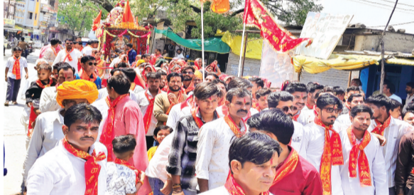
हरिभूमि न्यूज | खुजनेर

संत शिरोमणि सेन महाराज के जन्मोत्सव के अवसर पर सर्व सेन समाज नगर खुजनेर एवं ग्रामीण क्षेत्र समिति द्वारा मंगलवार को चल समारोह निकाला गया। चल समारोह की शुरुआत मांगलिक भवन से पूजन-अर्चना के साथ हुई। इसके बाद चल समारोह नगर के प्रमुख मार्ग राजगढ़ चौराहा, शिवाजी बाजार, मजौद चौक और हाट बाजार से होती हुई पुनः मांगलिक भवन पहुंचा। इस दौरान रास्तेभर समाजजनों और नगरवासियों ने पुष्प वर्षा कर चल समारोह का स्वागत किया। समारोह में शामिल श्रद्धालु भक्ति गीतों और ढोल-नगाड़ों की धुन पर आगे बढ़ते रहे। नगर में कई स्थानों पर स्वागत मंच बनाए गए, जहां समाजबंधुओं का स्वागत किया गया।