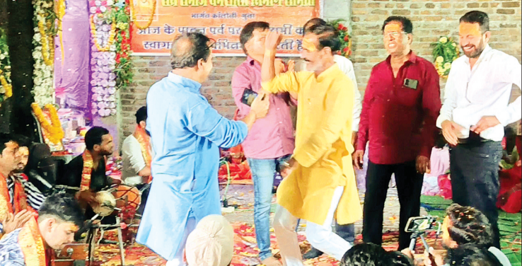
हरिभूमि न्यूज गुना

संत शिरोमणि सेनजी महाराज के 726 वे जन्मोत्सव के अवसर पर सेन समाज द्वारा भार्गव कॉलोनी स्थित सेन समाज धर्मशाला में धार्मिक एवं सांस्कृतिक कार्यक्रमों का आयोजन किया गया। इस अवसर पर बड़ी संख्या में समाजजन शामिल हुए। कार्यक्रम की शुरुआत प्रातःकालअभिषेक एवं विधि-विधान से पूजा-अर्चना के साथ हुई। इस मौके पर